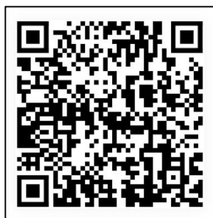
图 B.1 某排放口 QR 码生成示例

以上字符串共包含 118 个字母数字字符。采用 QR 码，符号规格设置为 41 \times 41 模块（版本 6），设置纠错等级为 L 级（7%），生成二维码如图 B.1：